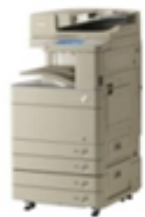
CFP 宣言認定を取得した 「imageRUNNER ADVANCE C5255」のCFPマーク